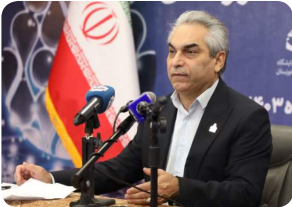
میزان گازسوزی در دارخوین به حداقل برسد.