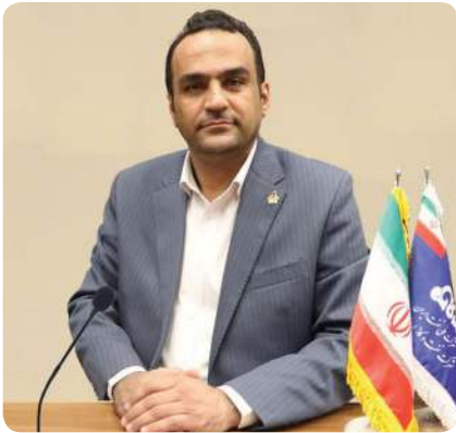
پایدار جلوگیری شود.

اعتماد در پایان به اهمیت حفاظت از خوردگی فلزات اشاره کرد و گفت: خوردگی یکی از مهمترین عوامل تخریب تاسیسات نفتی است. به همین دلیل، جهت کنترل نرخ خوردگی و افزایش عمر مفید تجهیزات، علاوه بر استفاده از آلیاژها و پوشش های مقاوم در برابر خوردگی، تزریق انواع بازدارنده، پایش و نگهداری سامانه های حفاظت کاتدی و ارزیابی پوشش در کنار بازرسی های دوره ای از تجهیزات در دستور کار قرار دارد.